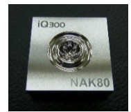
高品位加工紹介 (Ra 30 nm)

※新型コロナウイルス感染拡大状況により、中止又は内容を変更する場合がありますのでご了承ください。