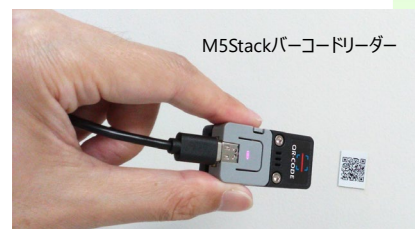
M5Stackバーコードリーダー